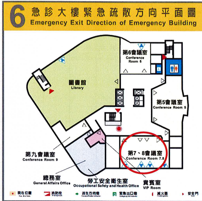
急診大樓 6樓 第五會議室平面圖