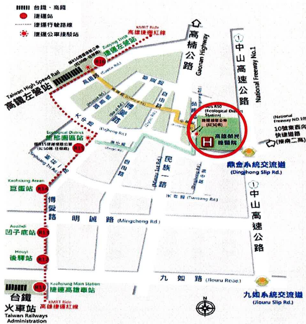
高雄榮民總醫院交通指引路線圖