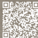
一般民眾NSO場次報名資訊