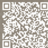
醫護專場報名資訊