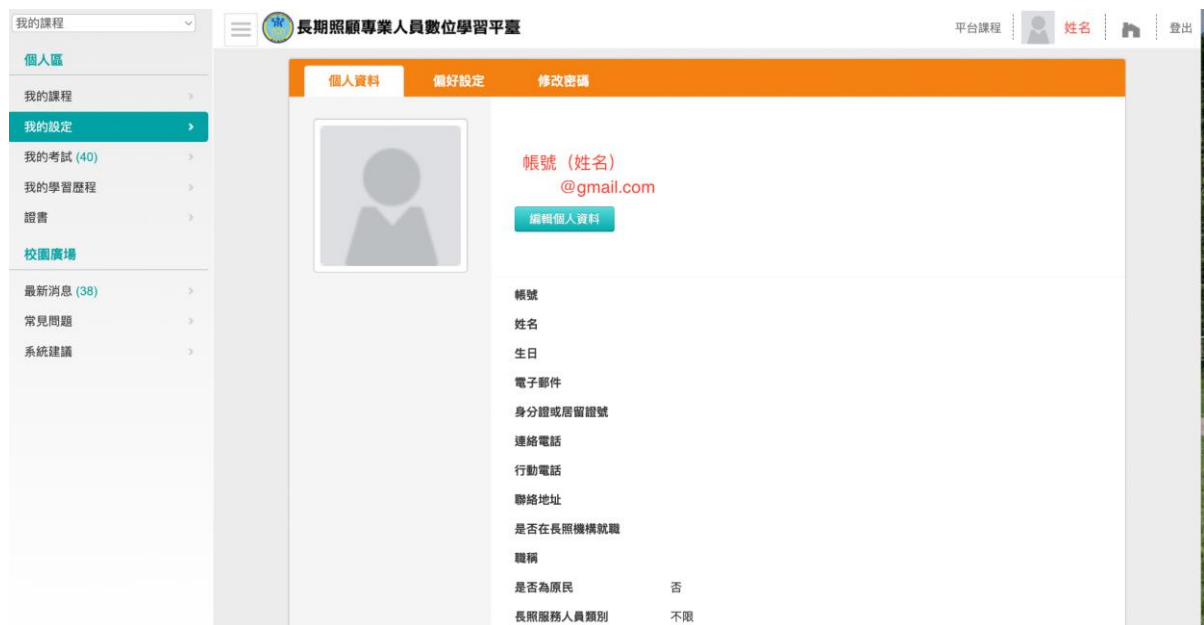
圖 2 長期照顧專業人員數位學習平台個人資料畫面