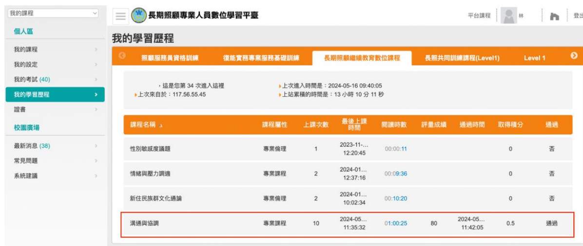
圖 1 長期照顧專業人員數位學習平台積分通過畫面